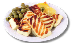
جبنة حلومي مشوي