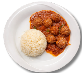
19,9 داود باشا كرات اللحم البقري مع صلصة الطماطم والأرز