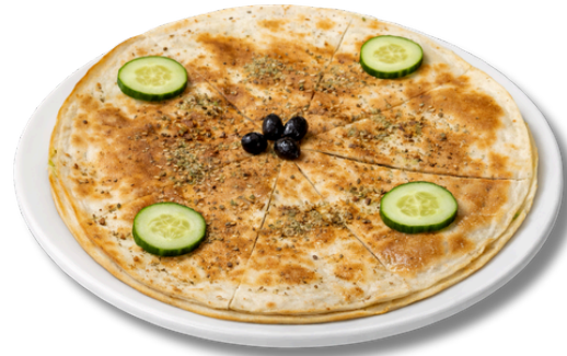
14.9 فطيرة جبنة مع الزعتر جين خروف محمص مع البقدونس والسمن والبيض والزعتر