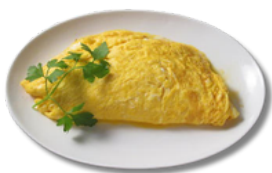
بيض مقلي مع الجبنة