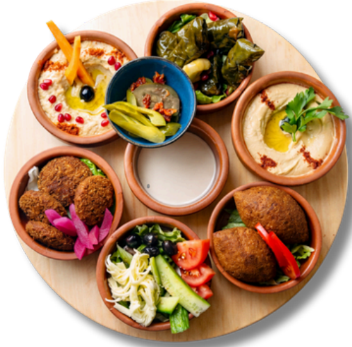
42,9 لشخصين صحن مشكل فلافل و حمص و متبل و ورق العنب و كبة