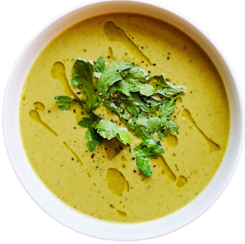
7.9 شوربة عدس عدس أحمر، بصل، جزر