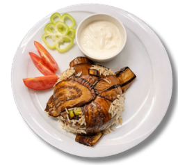
19,9 مقلوبة بادنجان مع اللحم البقري والأرز