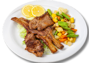
ريش لحم الضان