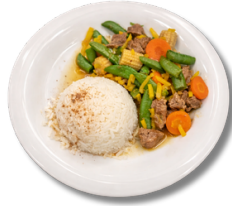
18,9 لحم البقر أو الدجاج مع الخضار الموسمية والأرز