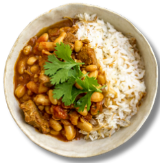
18,9 فاصوليا مع أو بدون لحم البقر والأرز