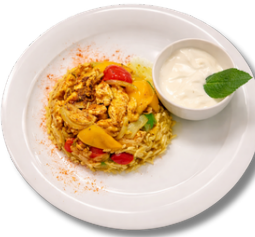
19,9 برياني لحم أو دجاج 24,9 أو الروبيان