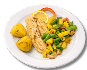
24,9 فيليه سمك مع الخضار والبطاطا