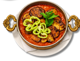
18,9 مسقعة نباتي بادنجان، صلصة الطماطم، فليفلة، البصل والثوم