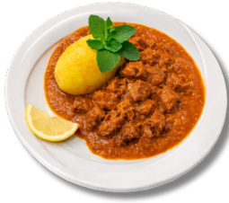
19,9 غولاش صالونة لحم بقري