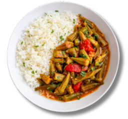
18,9 بامية مع أو بدون لحم البقر والأرز