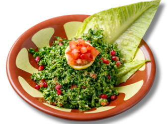
14.9 تبولة بقدونس والبصل والبرغل والطماطم