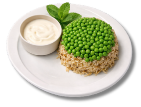
18,9 أوزي بازلاء الخضراء واللحم البقري والأرز مع الزبادي