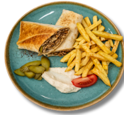
17,9 صحن شاورما دجاج عربي