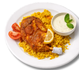
24,9 وجبة السلطان نصف فروج مشوي مع رز البرياني