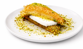
بقلاوة بالآيس كريم