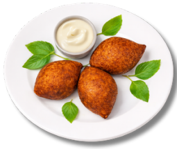
18,9 كبة قطع 3 كرات لحم البقر المقلي أو كرات نباتية